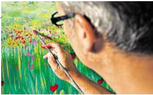
Bunte Blumenwiese: Winkler mag die figürliche Darstellung.