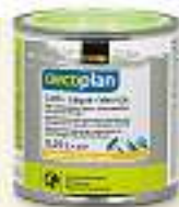
Oecoplan Lacke 0,5 l, Fr. 19.90 0,25 l, Fr. 11.90.

Diese und viele andere Farbqualitäten sind bei Coop Bau + Hobby erhältlich.