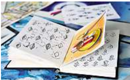
Skizzenblock: «Manchmal ist die Skizze besser als das fertige Bild», findet Winkler.