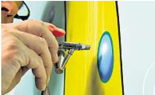
Präzision mit der Spritzpistole: Ein grosses Wandbild bekommt den letzten Schliff.