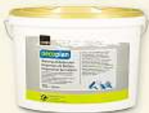
Oecoplan Dispersion weiss: 15 l, Fr. 84.90; 10 l, Fr. 59.90; 5 l, Fr. 35.90; 2,5 l, Fr. 19.90