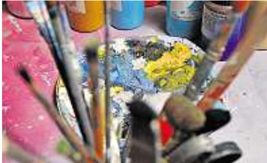
Malerei und Airbrush: Der Künstler mischt die beiden Techniken.