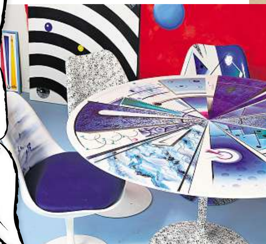
Designermöbel: Winkler hat sie neu gestaltet.

TEXT: KATALIN VEREB