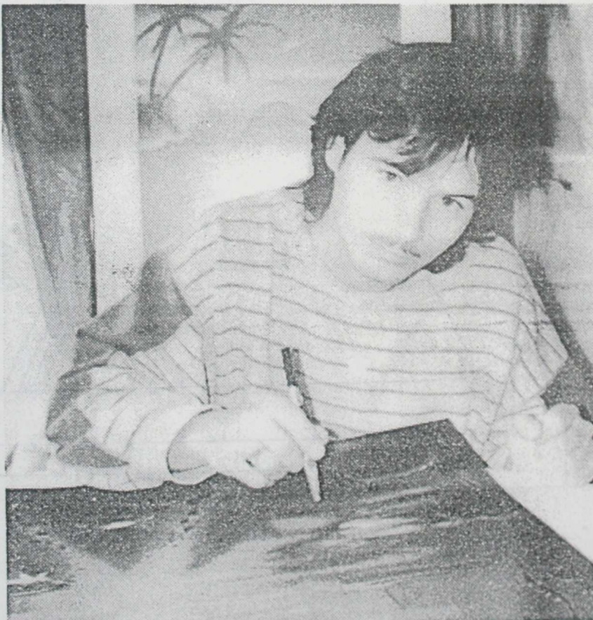
Bernhard Winklers Bilder spiegeln eine unwirkliche Wirklichkeit wider. Scharf umrissene Formen heben sich vom verschwommenen Umfeld ab.